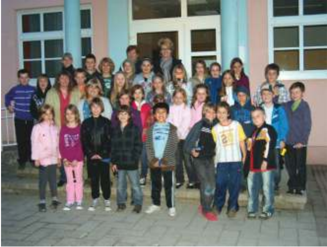
Die Kinder der 3b und 4. Klasse Volksschule bei der Lesenacht im Mai dieses Jahres