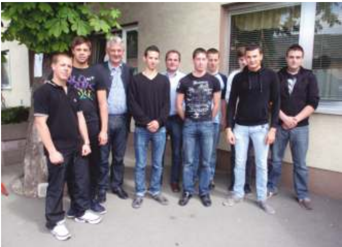
Die Großebersdorfer Rekruten nach der Musterung am 3. und 4. Mai 2011