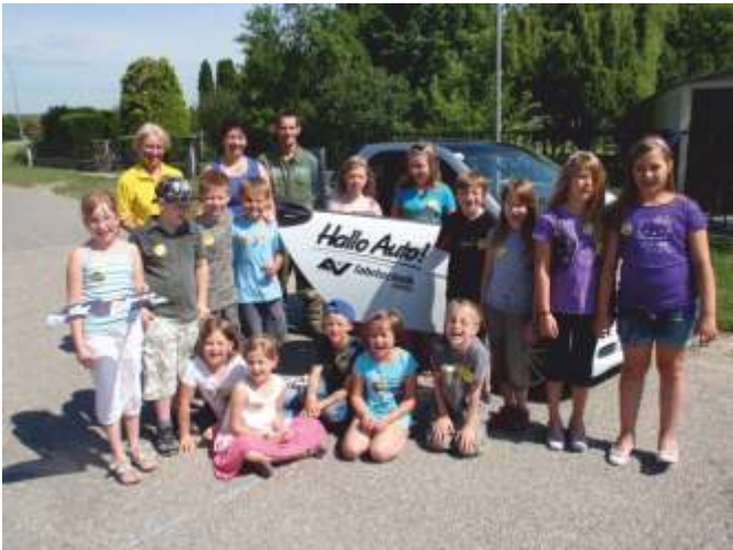
Die Kinder der 3a waren ebenfalls mit viel Eifer bei der Aktion „Hallo Auto“ dabei