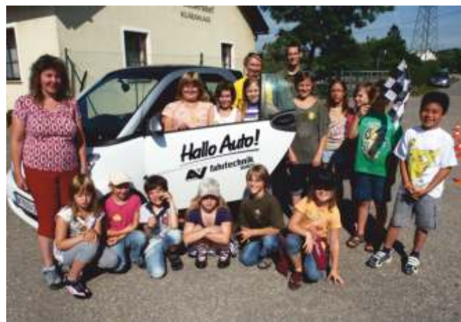
Die 3b der Volksschule Groöbersdorf bei der Veranstaltung „Hallo Auto“

Auch dieses Jahr veranstaltete der ÖAMTC gemeinsam mit der AUVA und der FF Groöbersdorf die Aktion „Hallo Auto“ für die 3. Klassen der VS Groöbersdorf. Die Kinder erfuhren viel über Reaktions- und Bremsweg, den Einfluss der Bodenbeschaffenheit und Witterungsbedingungen auf das Autofahren.