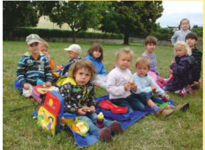
Die Kinder des Eibesbrunner Kindergartens beim Picknick am Wandertag