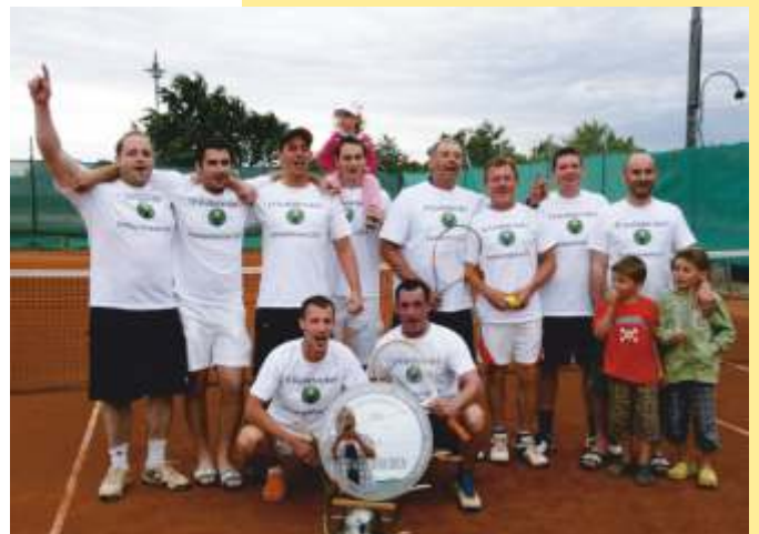
„Die Hirschen“ vom TV Großebersdorf 1 mit der Meisterschale 2010/2011