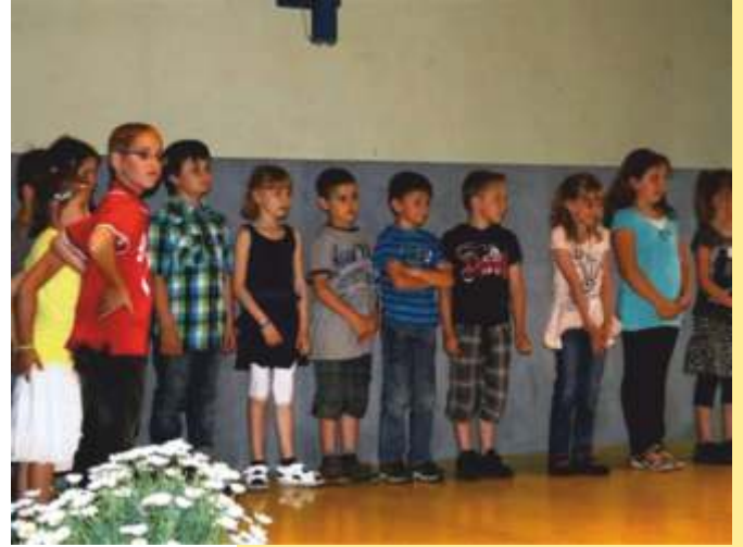
Die Kinder der 2. Klasse mit ihrer Aufführung beim Schulabschlussfest 2011