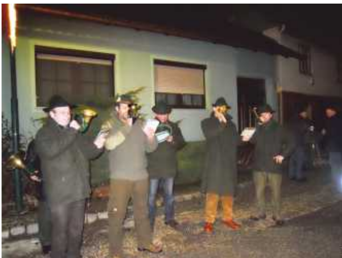
Die Jagdhornbläser aus dem Heegering Wolkersdorf bei der Jaga-Weihnacht