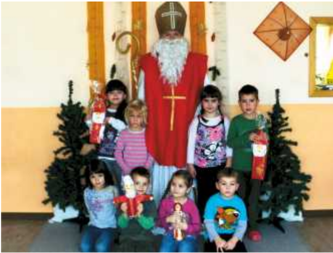
Der Heilige Nikolaus zu Gast im Kindergarten Eibesbrunn