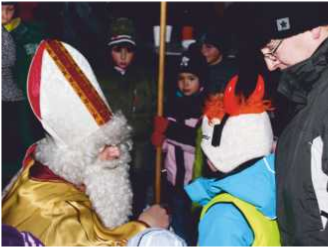
Der Heilige Nikolaus zu Besuch am Hauptplatz Manhartsbrunn