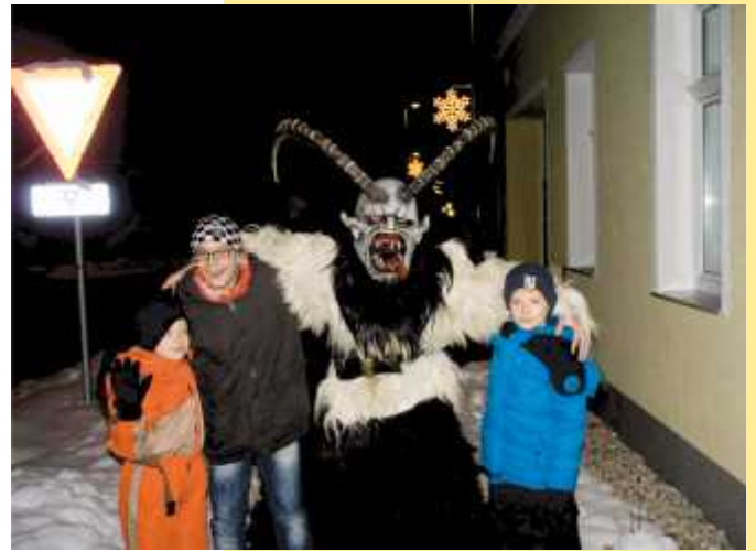
Am 4. Dez. stürmten verschiedene Perchten-Passen durch die Grobebersdorfer Straßen