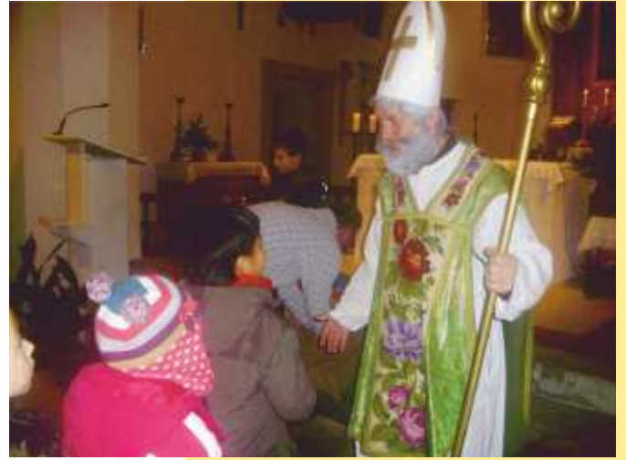
Der Kirchenpatron der Pfarrkirche Grobebersdorf beschenkte die Grobebersdorfer Kinder